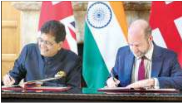
मजबूत करने का उद्देश्य है। उन्होंने इस बात पर जोर दिया कि जैसे-जैसे दोनों अर्थव्यवस्थाएं अपनी व्यावसायिक साझेदारी को गहरा कर रही हैं, वैसे-वैसे विवाद समाधान तंत्र में भरोसा होना भी उतना ही महत्वपूर्ण है।

लंदन। भारत के मुख्य न्यायाधीश (सीजेआई) सूर्यकांत ने भारत और ब्रिटेन के बीच हुए मुक्त व्यापार समझौते (एफटीए) को दोनों देशों के लिए एक ऐतिहासिक क्षण बताया है। उन्होंने कहा कि यह समझौता मध्यस्थता और सुलह के क्षेत्र में सह-निर्माण के लिए एक मजबूत