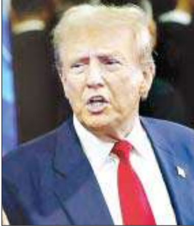
अनुसार, अमेरिकी सांसदों को पिछले महीने दी गई ब्रीफिंग में बताया गया था कि ईरान ने होर्मुज

वॉशिंगटन। अमेरिकी राष्ट्रपति डोनाल्ड ट्रंप ने दावा किया है कि हालिया संघर्ष के बाद ईरान की मिसाइल क्षमता को भारी नुकसान पहुंचा है। उन्होंने कहा कि अब ईरान के पास पहले की तुलना में केवल एक छोटा हिस्सा ही बचा है। साथ ही उन्होंने कहा कि ईरान फिलहाल परमाणु हथियार विकसित करने की स्थिति में नहीं है। एनबीसी न्यूज के कार्यक्रम मीट द प्रेस को दिए इंटरव्यू में ट्रंप ने कहा कि अमेरिका ने ईरान की सैन्य क्षमता को पूरी तरह तबाह कर दिया है। उन्होंने दावा किया कि तेहरान के पास अब अपनी पुरानी मिसाइल क्षमता का केवल 21 से 22 प्रतिशत हिस्सा ही बचा है। ट्रंप ने कहा कि उनके पास अब भी काफी मिसाइलें हैं, लेकिन जब हमने हमला शुरू किया था, तब जितनी थी, उतनी नहीं है। हालांकि ट्रंप का यह दावा अमेरिकी खुफिया एजेंसियों की रिपोर्ट से मेल नहीं खाता। द न्यूयॉर्क टाइम्स की एक रिपोर्ट के