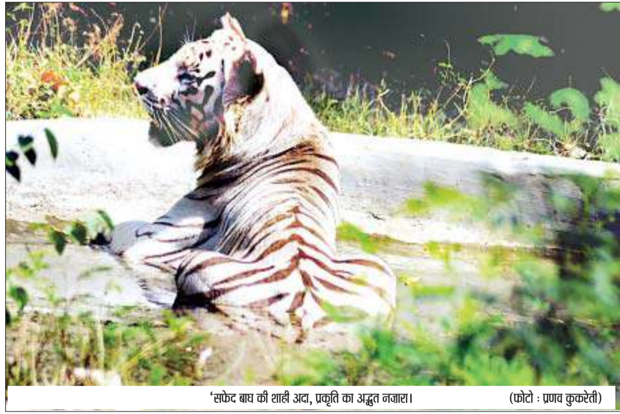
‘सफेद बाघ की शाही अदा, प्रकृति का अद्भुत नजारा।

जलडमरूमध्य के पास स्थित अपनी 33 में से 30 मिसाइल साइटों पर फिर से परिचालन नियंत्रण स्थापित कर लिया है। रिपोर्ट में यह भी कहा गया कि ईरान के पास संघर्ष से पहले के मिसाइल भंडार का लगभग 70 प्रतिशत हिस्सा अब भी मौजूद है। होर्मुज जलडमरूमध्य में जारी तनाव पर ट्रंप ने भरोसा जताते हुए कहा कि स्थिति जल्द सामान्य हो जाएगी। जब उनसे पूछा गया कि उनकी सरकार ने कितने वाणिज्यिक तेल टैंकरों को सुरक्षित मार्ग उपलब्ध कराया है, तो उन्होंने कहा कि बहुत सारे। मैं संख्या नहीं बताना चाहता, लेकिन काफी अधिक। यह बयान ऐसे समय आया है जब अमेरिका में पेट्रोल और ईंधन की बढ़ती कीमतों को लेकर ट्रंप और उनकी रिपब्लिकन पार्टी घरेलू राजनीतिक दबाव का सामना कर रहे हैं। आगामी मध्यवधि चुनावों से पहले महंगाई और ऊर्जा कीमतें प्रमुख राजनीतिक मुद्दे बनी हुई हैं।