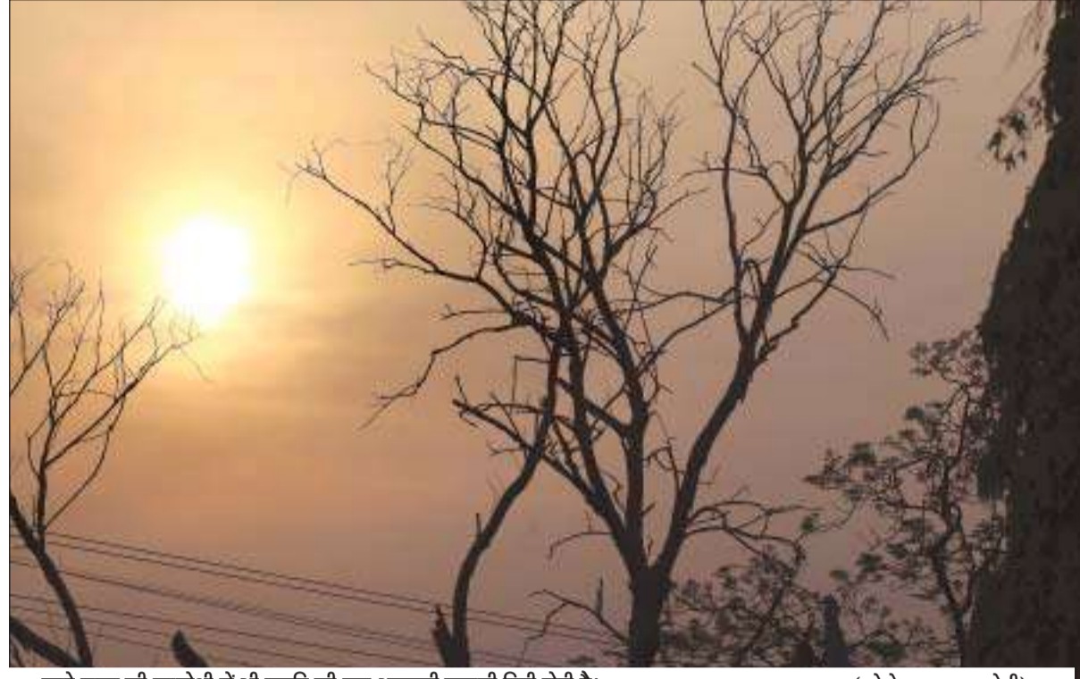
डूबते सूरज की खामोशी में भी प्रकृति की एक अनकही कहानी छिपी होती है।