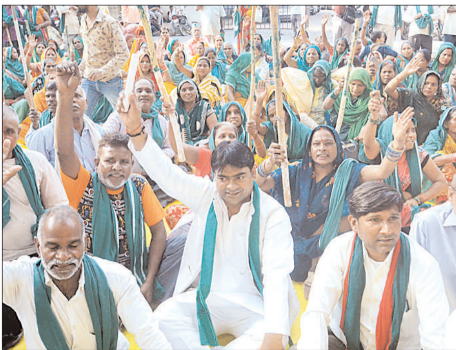
गोखले मार्ग स्थित मध्यांचल विद्युत वितरण निगम कार्यालय पर बिजली की दरों में 10% की बढ़ोतरी व अन्य मामलों को लेकर घेराव कर प्रदर्शन करते एडवा के सदस्य

पंक्तियां- वक्त आ गया सुनो हिन्दुओं, जीना है तो लड़ना सीखो... पर उपस्थित श्रोताओं ने जोरदार तालियों से उनका स्वागत किया। कार्यक्रम की मुख्य अतिथि प्रदेश सरकार की महिला कल्याण, बाल विकास एवं पुष्टहार मंत्री बेबी रानी मौर्य ने कहा कि वीर सावरकर का जीवन राष्ट्रभक्ति, साहस और आत्मबल का अनुपम उदाहरण है। विशिष्ट अतिथि एवं राज्य मंत्री (स्वतंत्र प्रभार) श्री असीम अग्रन ने युवाओं से सावरकर के विचारों को आत्मसात करने का आह्वान किया। पूर्व बेसिक शिक्षा राज्य मंत्री प्रो. (डॉ.) सतीश द्विवेदी ने सावरकर को भारतीय राष्ट्रचेतना का प्रखर प्रवक्ता बताया। कार्यक्रम के मुख्य वक्ता एवं माय होम इंडिया के संस्थापक श्री सुनील देवधर ने कहा कि सावरकर के विचार आज भी भारत की राष्ट्रीय अस्मिता को दिशा देने का कार्य कर रहे हैं। अग्रशक्ति का रहे महाराष्ट्र के पूर्व गृह राज्य मंत्री श्री कृपाशंकर सिंह ने कहा कि राष्ट्रहित सर्वोपरि रखने की प्रेरणा हमें सावरकर के जीवन से मिलती है।