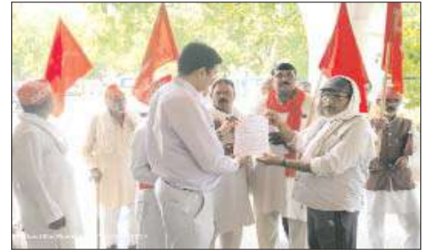
उर्ड : प्रशासन को ज्ञापन देते भाकपा माले पदाधिकारी ।