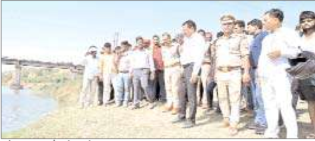
उर्ड : घटना स्थल पर मौजूद डीएम एसपी ।