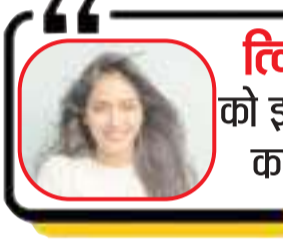
त्विषा को इसाफ कब?

महत्वपूर्ण तथ्य उजागर हो सकते हैं। इसी कारण विशेषज्ञ लगातार डेटा एनालिसिस में जुटे हुए हैं और हर तकनीकी पहलू की दोबारा पुष्टि की जा रही है। सीबीआई फिलहाल मोबाइल के कॉल लॉग्स, सोशल मीडिया गतिविधियों और विशेष रूप से वॉट्सऐप चैट रिकॉर्ड की गहन पड़ताल कर रही है। बताया जा रहा है कि मोबाइल में बड़ी संख्या में संदेश और चैट मौजूद थे, जिनमें से कई डिलीट किए जा चुके हैं। इन डेटा को रिकवर करने के लिए एजेंसी फॉरेंसिक इमेजिंग और क्लोनिंग तकनीक का उपयोग कर रही है। इसके बाद राइड ब्लॉकर टूल की मदद से डेटा को सुरक्षित रखते हुए एक्सेस और सेलेब्राइट जैसे एडवांस फॉरेंसिक सॉफ्टवेयर के जरिए डिलीट संदेश, फोटो और चैट को पुनः प्राप्त करने का प्रयास किया जा रहा है। साथ ही वॉट्सऐप बैकअप फाइल्स को डिफ्रिक्ट कर उनके कंटेंट की भी जांच की जा रही है।