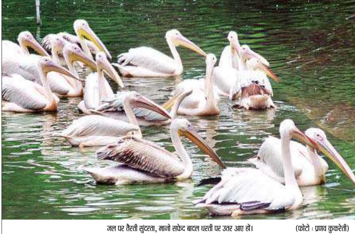
जल पर तैरती सुंदरता, मानो सफेद बादल धरती पर उतर आए हों।

हेलसिंकी। रूस से तेल खरीदने के मामले में भारत को फिनलैंड से अप्रत्याशित समर्थन मिला। फिनलैंड की विदेश मंत्री एलिना वाल्टोनन ने कहा कि नई दिल्ली ने यूक्रेन पर रूस के हमले के बाद पश्चिमी देशों द्वारा तय की गई तेल की कीमत की सीमा (प्राइस कैप) के दायरे में रहकर ही काम किया है। फिनलैंड में कुलतारता टॉक्स के दौरान एक पैनल चर्चा में बोलते हुए फिनलैंड मंत्री ने कहा कि पश्चिमी देशों की प्राइस कैप व्यवस्था का मकसद कभी भी देशों को रूस से कच्चा तेल खरीदने से पूरी तरह रोकना नहीं था। इस चर्चा में विदेश मंत्री एस. जयशंकर ने वाल्टोनन और यूई की सहायक विदेश मंत्री लाना नुसेबेह के साथ हिस्सा लिया था। वाल्टोनन ने कहा कि भारत के बचाव में यह कहा जा सकता है कि उसने प्राइस कैप के तहत तेल खरीदा है।