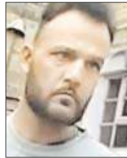
सुनवाई के दौरान बताया गया कि 24 साल की पीड़ित महिला

उसे 34 साल की सजा काटनी होगी, जिसमें 28 साल जेल में बिताने होंगे और उसके बाद कड़ी पाबंदियों के साथ छह साल की बड़ी हुई लाइसेंस अवधि होगी। जब तक वह कम से कम 18 साल या जेल की सजा का दो-तिहाई हिस्सा पूरा नहीं कर लेता, तब तक उसे पैरोल देने पर विचार नहीं किया जा