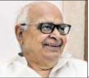
- हृदयनारायण दीक्षित

राष्ट्रीय जीवन के विविध क्षेत्रों में राजनीति सबसे सक्रिय क्षेत्र है। राजनीति से ही विधायिका जनहितकारी अधिनियम करती है। राजनीति के विचार प्रभाव में राष्ट्र शक्तिशाली होते हैं। राजनीति में सक्रिय सामाजिक कार्यकर्ता देर सबेर सरकार बनाते हैं। भारत दुनिया का सबसे बड़ा लोकतंत्र है। स्वाधीनता आंदोलन के समय समाज जीवन के विभिन्न क्षेत्रों में काम करने वाले सक्रिय रहे हैं। स्वाधीनता आंदोलन के जीवन मूल्य त्याग आधारित थे। स्वतंत्र भारत में राजनीति के उच्चतर मूल्य घटने लगे। दलतंत्र में विश्वास का संकट बढ़ता गया। अटल बिहारी वाजपेयी जैसे नेताओं ने राजनीति पर आए विश्वास के संकट पर कई बार संसद में भी बेचैनी व्यक्त की। लोकनायक जयप्रकाश नारायण ने सम्पूर्ण क्रांति का आंदोलन चलाया। अन्ना हजारे का आंदोलन भी चला था, लेकिन देश के प्रबुद्ध क्षेत्रों में राजनीति के प्रति निराशा पैदा होती चली गई। लेकिन राजनीति में परिवारवाद, जातिवाद और अल्पसंख्यक तुष्टिकरण बढ़ते गए। राजनीति विचार आधारित नहीं रही। ऐसे में विचार आधारित राजनीति के योद्धा नरेन्द्र मोदी का राष्ट्रीय राजनीति में पदार्पण