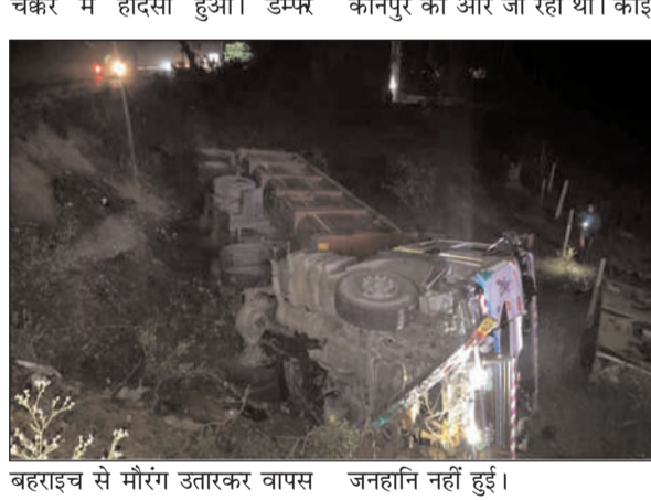
बहराइच से मौरंग उतरकर वापस जहनानि नहीं हुई।