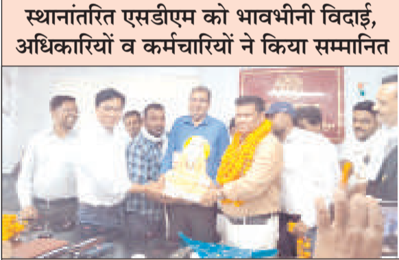
कालपी : विदाई समारोह में स्थानांतरित एसडीएम का सम्मान करते अधिकारी एवं कर्मचारी।