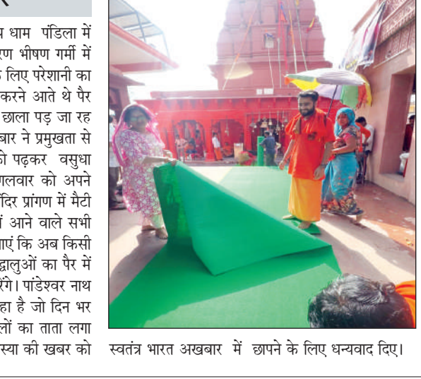
स्वतंत्र भारत अखबार में छापने के लिए धन्यवाद दिए।