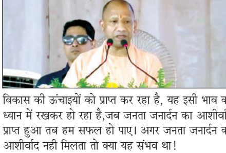
विकास की ऊंचाइयों को प्राप्त कर रहा है, यह इसी भाव को ध्यान में रखकर हो रहा है, जब जनता जनार्दन का आशीर्वाद प्राप्त हुआ तब हम सफल हो पाए। अगर जनता जनार्दन का आशीर्वाद नहीं मिलता तो क्या यह संभव था!

स्वतंत्र भारत प्रयागराज। प्रयागराज नगर निगम के नव-निर्मित सदन हॉल और विभिन्न विकास परियोजनाओं का लोकार्पण-शिलान्यास कार्यक्रम में मुख्यमंत्री योगी आदित्यनाथ ने अपने संबोधन में कहा प्रयागराजवासियों के प्रति मैं आप्तारी हूँ कि महाकुंभ में 45 दिनों तक प्रयागराजवासियों के आवागमन बाधित रहा, लेकिन किसी भी प्रयागराजवासी ने कभी कोई विरोधी स्वर नहीं उठाया। ऐसा लगता था जैसे उनके घर का कार्यक्रम हो। विकास तभी होता है, जब सार्वजनिक कार्यक्रमों को, इस प्रकार के बड़े आयोजनों लोग अपना मानते हैं, तब विकास होता है। आज उत्तरप्रदेश जिन