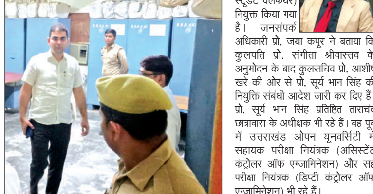
स्वतंत्र भारत अखबार में छापने के लिए धन्यवाद दिए।