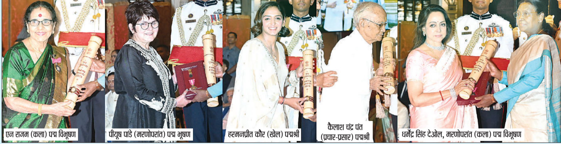
एन राजम (कला) पद्म विभूषण