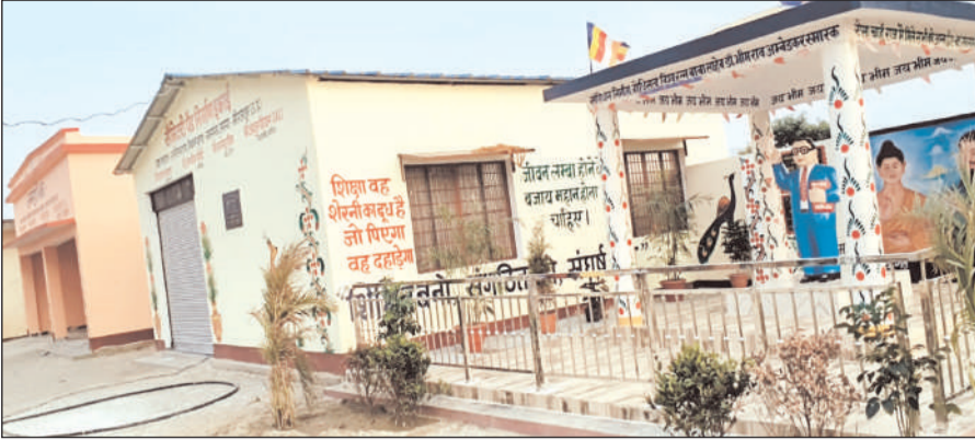
साहब डा.क.भीमराव आंबेडकर की प्रतिमा के सौंदर्यीकरण और तारबंदी