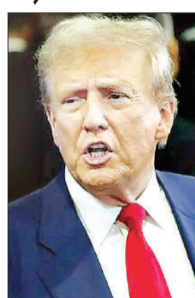
डोनाल्ड ट्रंप ने फिर दावा किया कि अमेरिका ने ईरान के खिलाफ लड़ाई जीत ली है। उन्होंने कहा कि

कर अधिक समय देने का अनुरोध किया था। ट्रंप ने कहा, उन्होंने मेरे लोगों के माध्यम में मुझसे अपील की थी कि क्या हमें और समय मिल सकता है? अगर वे अपना काम नहीं करते हैं तो मैं उनके बिजली संयंत्रों को नष्ट कर दूंगा। ट्रंप ने कहा, उन्होंने सात दिन मांगे थे और मैंने कहा, मैं आपको 10 दिन दूंगा क्योंकि उन्होंने मुझे जहाज दिए थे। ट्रंप ने ईरान के साथ बातचीत पर कहा कि ईरान के फर्जी समाचार मीडिया और अन्य लोगों द्वारा गलत बयानबाजी के बावजूद ईरान के साथ बातचीत अच्छी तरह से आगे बढ़ रही है। अमेरिकी राष्ट्रपति