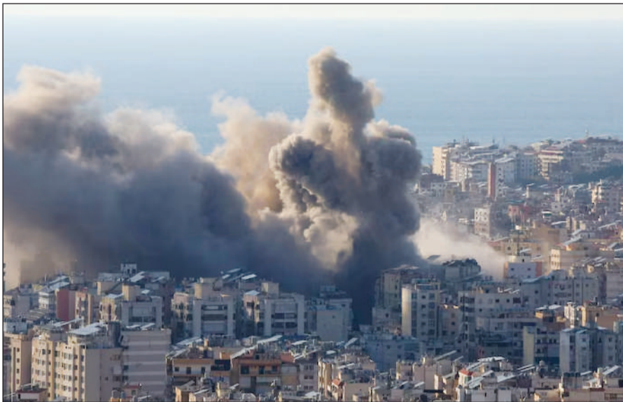
प्यूल टैंकों को भारी नुकसान पहुंचा है। कुवैत और यूएई के अल-धाफरा

न्यूज एजेंसी एएनआई के मुताबिक, ईरान ने सीधे अमेरिकी अड्डों को अपना निशाना बनाया है। कुवैत के अली अल-सलेम एयरबेस और बहरैन के शेख ईसा बेस पर ईरानी मिसाइलें गिरी हैं। बताया जा रहा है कि बहरैन में पैट्रियट मिसाइल सिस्टम के रिपेयर हैबर और जेट